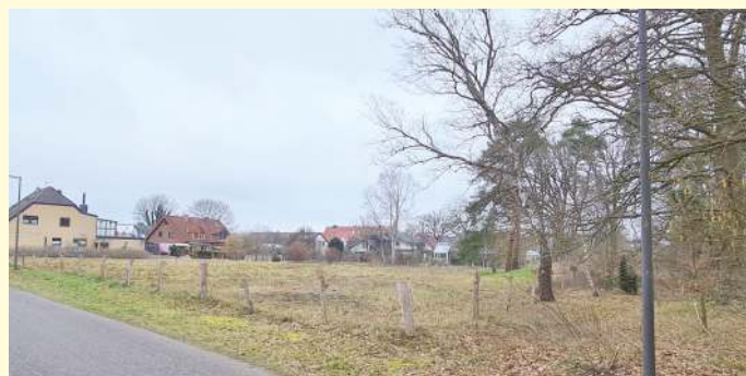
Das Foto zeigt das künftige Baugebiet.