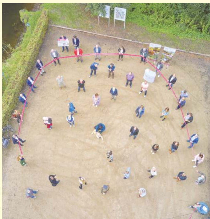
Einweihung auf Abstand: Am Gasthaus Knollmeyer an der Nette wurden von Landrätin Anna Kebschull und zahlreichen geladenen Gästen mit dem feierlichen Durchschneiden eines Bandes 41 neue Wanderwege „TERRA.tracks“ im Nordkreis freigegeben.

Von ehemals 14 Rundwanderwegen mit insgesamt mehr als 90 Streckenkilometern auf Belmer Gebiet bleiben vier TERRA.tracks mit insgesamt 30 Kilometern übrig. Die Auswahl