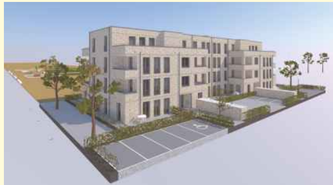
So wird das Gebäude nach seiner endgültigen Fertigstellung aussehen.

Eine Besonderheit des Gebäudes ist seine Lage im Zentrum des Landwehrviertels - direkt an der Grünen Mitte, die in Zukunft das grüne Herz des Quartiers bilden wird. Das in etwas mehr als einem Jahr Bauzeit geschaffene Mehrfamilienhaus beinhaltet 22 Zwei- bis Vierzimmerwohnungen mit einer Größe von 60 bis 115 Quadratmetern und ist im KfW-Energiestandard 55 errichtet. Alle Wohnungen verfügen über Balkon, Loggia oder (Dach-) Terrasse. Auf den Dachflächen ist zudem eine Photovoltaikanlage installiert.