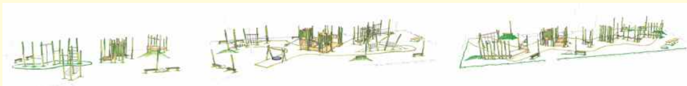
So soll das durch die Bürgerbeteiligung ausgewählte Spielband nach den Entwürfen der Firma MerryGoRound künftig aussehen.