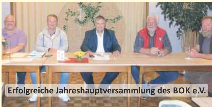
Erfolgreiche Jahreshauptversammlung des BOK e.V.