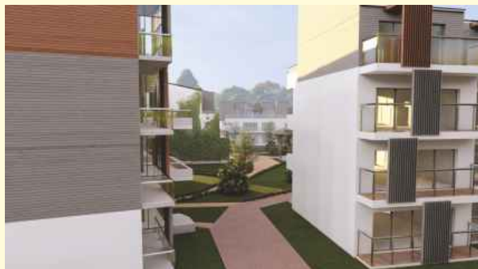
Insgesamt 53 Wohneinheiten plant die WENGEOS im Landwehrviertel in Osnabrück auf einem 7288 Quadratmeter großen Grundstück. Grafik: WENGEOS eG

Die Vision: Eine Wohnanlage mit Bewohner*innen aus unterschiedlichen Generationen, die eine große Gemeinschaft bilden, sich solidarisch unterstützen und gegenseitig helfen, wo es sinnvoll und nötig ist. So entsteht ein nachbarschaftliches Netzwerk, in das sich jede*r mit einbringen kann. Diese Idee für gemeinschaftliches Wohnen steht hinter dem Projekt „WENGE QUARTIER Landwehrviertel“, das die Wohnungs- und Energiegenossenschaft Osnabrück (WENGEOS) realisieren möchte. Jetzt macht das Vorhaben einen großen Schritt nach vorne: Die WENGEOS hat einen Kaufvertrag über ein 7288 Quadratmeter großes Grundstück im Osnabrücker Landwehrviertel mit der Stadtwerke-Tochter ESOS Energieservice Osnabrück GmbH (ESOS) abgeschlossen.