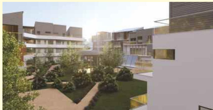
Um einen gemeinschaftlich genutzten Garten sind die sieben Gebäude im WENGE Quartier Landwehrviertel gruppiert. Grafik: WENGEOS eG

Jede Mietpartei muss Mitglied in der Genossenschaft werden und abhängig von der Wohnungsgröße Genossenschaftsanteile erwerben. „Diese sind vergleichbar mit einer Kautions, die auch bei anderen Mietwohnungen hinterlegt werden muss. Unsere Mitglieder werden aber an den Gewinnen der Genossenschaft beteiligt“, sagt Walter. Ein Teil der Mieter*innen müsse außerdem einen Baukostenzuschuss zahlen. 30 Prozent der Wohnungen werden an Menschen vergeben, die einen Wohnberechtigungsschein haben. Weitere 30 Prozent der Objekte richten sich nach dem normalen Mietpreisspiegel in Osnabrück und 40 Prozent sind als Premium-Wohnungen geplant. Die gesamte Investitionssumme kalkuliert die Genossenschaft auf 12,8 Millionen Euro. 865.000 Euro werden über die Mitglieder als Eigenkapital eingebracht. Weitere 800.000 Euro sollen von Investoren eingebracht werden, die eine festgelegte Rendite erhalten.