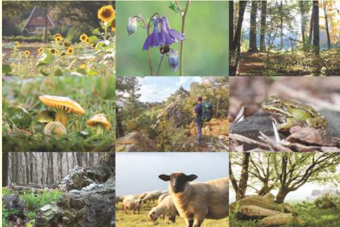
Für den Fotowettbewerb von TERRA.vita können Fotografinnen und Fotografen jeweils ein Bild einreichen – so könnten die Motive aussehen.

Osnabrück. Regionale Hobbyfotografinnen und –fotografen sind gefragt: Der Natur- und Geopark TERRA.vita plant, Postkarten mit Motiven aus der Naturparkregion zu gestalten und ruft deshalb zu einem Fotowettbewerb auf. Titel: „So schön ist unsere Heimat!“