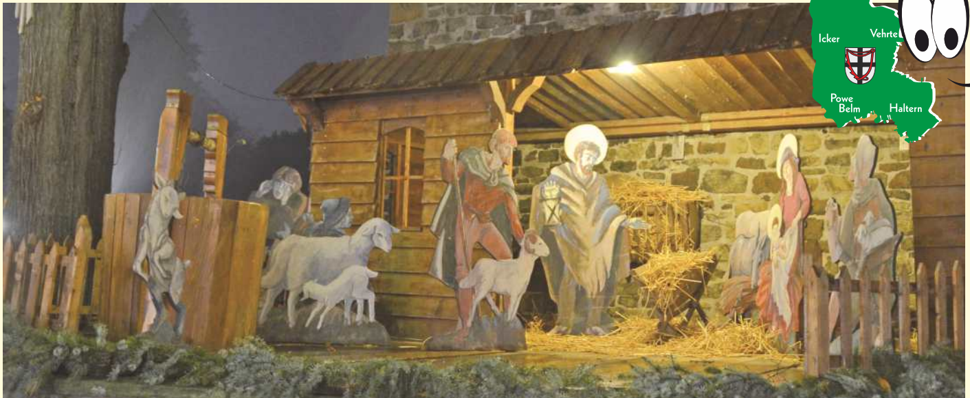
Die historische Krippe an der Außenmauer der St. Dionysius-Pfarrkirche am Tie gehört seit Jahrzehnten in der Adventszeit zum Ortsbild von Belm.